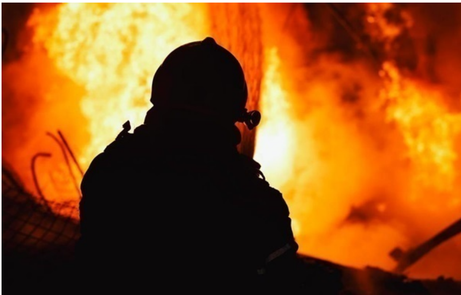
Фото: ДСНС (ілюстративне фото) Росіяни атакували заклад освіти в Семенівці