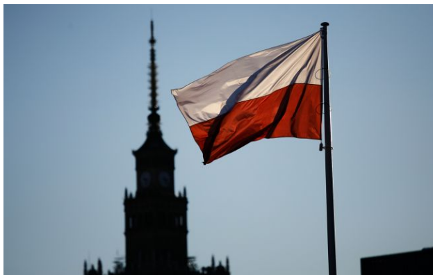
Фото: Українці в Польщі можуть оформити новий дозвіл на проживання

Обирайте перевірене - додайте РБК-Україна до улюблених джерел у Google