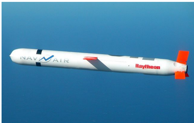
Фото: Tomahawk (navy.mil)

Обирайте перевірене - додайте РБК-Україна до улюблених джерел у Google