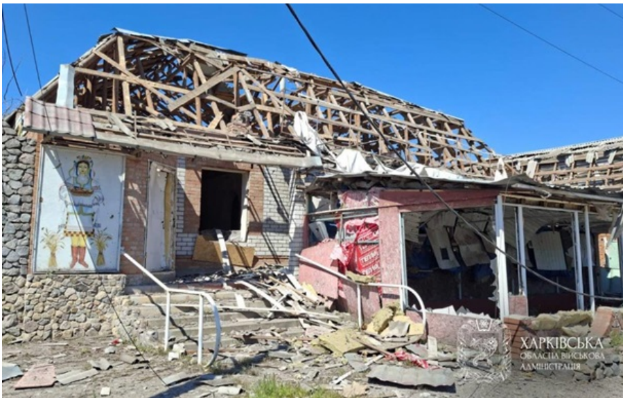
Наслідки російського удару по Мерефі

До лікарні потрапив 16-річний підліток. Ще двоє неповнолітніх – 2-річний хлопчик і 17-річний хлопець – отримали необхідні допомогу і продовжать лікування амбулаторно.