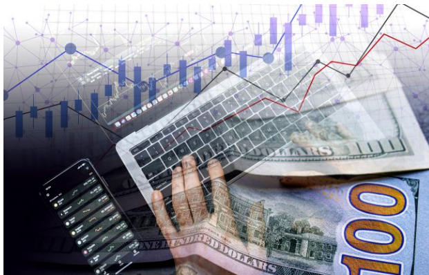
НБУ оновив офіційний курс валют на 5 травня

Обирайте перевірене - додайте РБК-Україна до улюблених джерел у Google