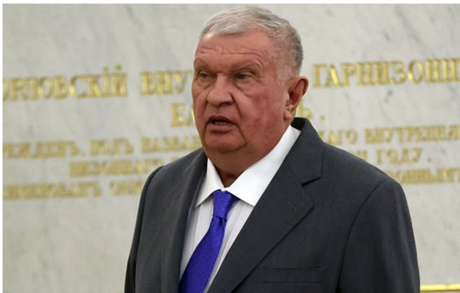
Глава Роснафти Ігор Сечін

Раніше Володимир Путін заявляв про необхідність створення "суверенних" моделей ШІ, які спираються на російську культуру, історію та "традиційні цінності".