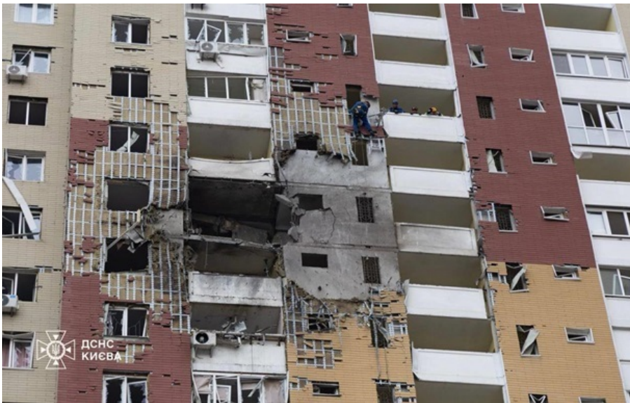
Наслідки атаки "шахеда" в Києві 16 квітня

В реальності України масована атака означає щонайменше 400 безпілотників у поєднанні з щонайменше 20 ракетами, зазначив очільник МЗС.