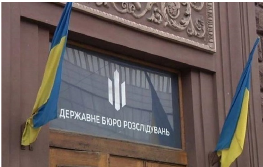
ДБР викрило схему незаконного відчуження готелю у Вінниці

Готель продавали частинами за заниженою вартістю, оформлюючи через підконтрольні структури. У результаті об'єкт фактично перейшов у приватні руки за заниженою ціною.