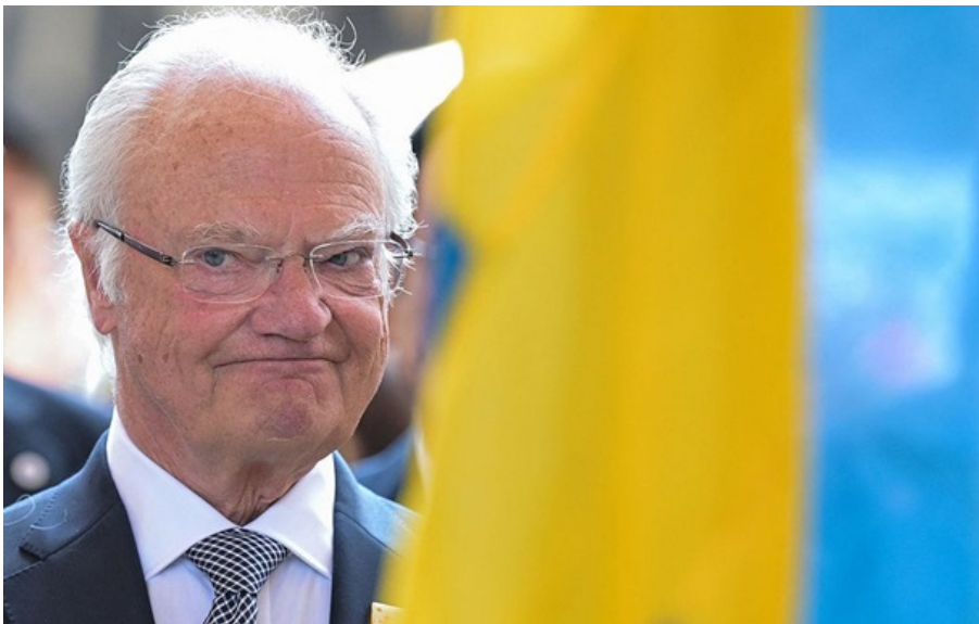
Карл XVI Густав перебуває у Львові

Ця поїздка є першим візитом монарха Швеції до України з початку повномасштабного російського вторгнення.