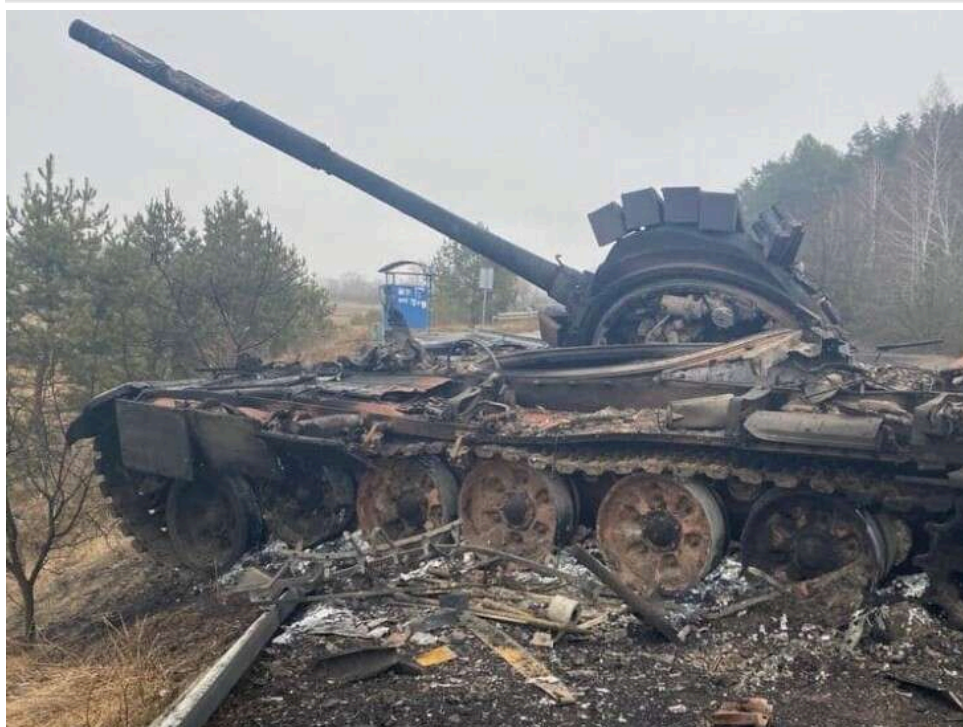
Понад 216 тисяч імен: журналісти встановили підтверджені втрати РФ

Станом на травень встановлено імена 216 205 російських військових, які загинули під час повномасштабного вторгнення в Україну.