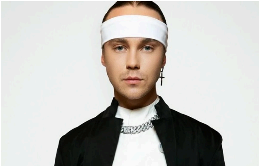
Артем Пивоваров

Один із глядачів раптово схопив його за шию просто під час перформансу, коли артист наблизився до публіки.