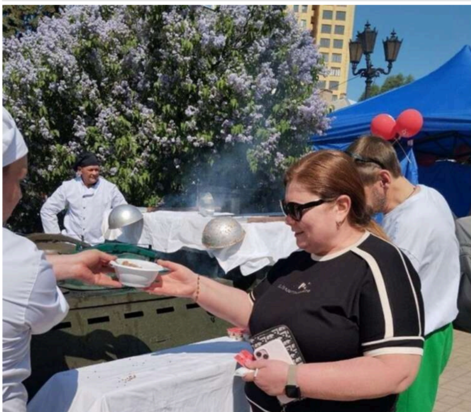
Без салютів та маршів: як пройшло 9 травня в окупованому Донецьку за "обмеженою програмою"

У окупованому Донецьку 9 травня 2026 року відбулися заходи за скороченою програмою. Відсутні були салют і хода «Безсмертного полку».