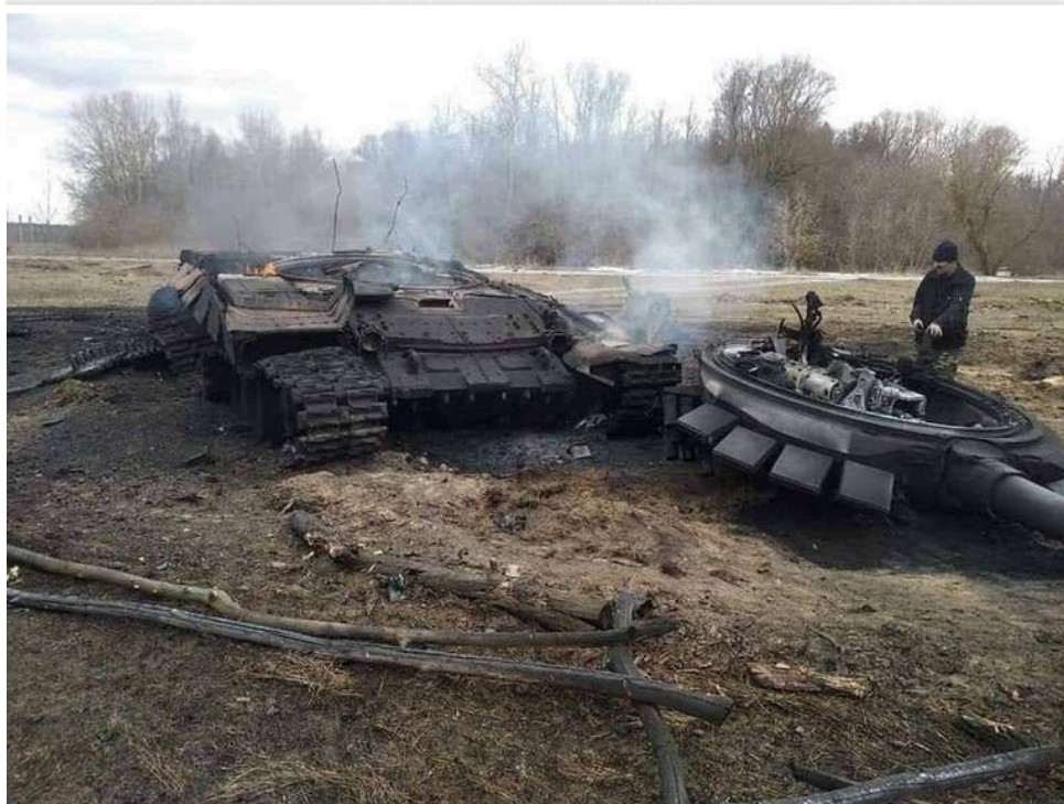
Втрати ворога за добу: ЗСУ знешкодили 840 окупантів і три бойові броньовані машини

За минулу добу Сили оборони України зменшили чисельність російської окупаційної армії на 840 окупантів. Загальні бойові втрати Росії в особовому складі досягають 1 341 110 осіб.