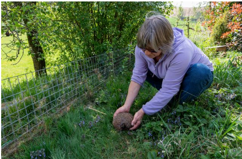
Колючі мандрівники - часті гості на присадибних ділянках