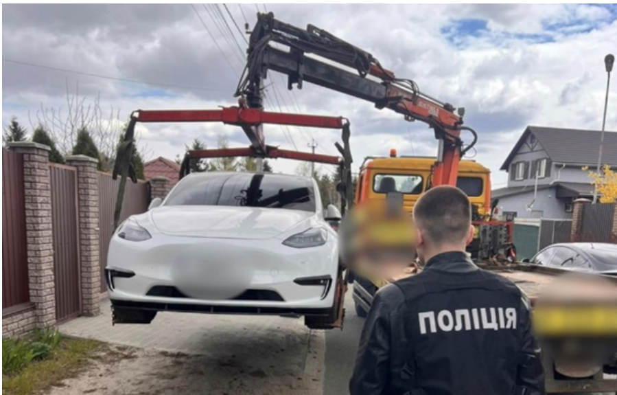
Вилучено автомобілі Tesla різних моделей

Серед задокументованих фактів – незаконне збагачення та випадки недостовірного декларування посадовців майже на 92 млн грн.