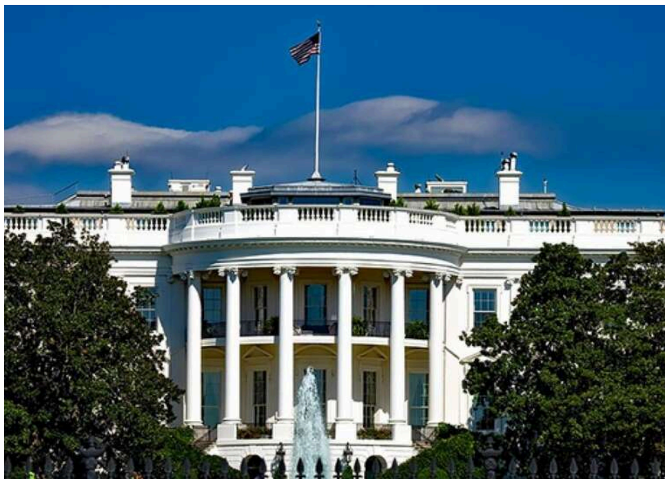
Трамп заблокував порти для кораблів РФ: США продовжили надзвичайний стан через російську загрозу

Американський президент Дональд Трамп продовжив на рік надзвичайний стан, запроваджений через загрозу з боку Росії, який обмежує пересування і стоянку російських суден в американських портах.