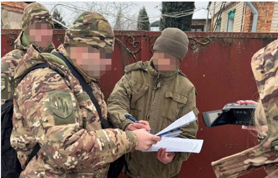
Судитимуть лісника-зрадника з Ізюма

На початку вторгнення він допоміг росіянам організувати засідку на військовослужбовців однієї з бригад тероборони.