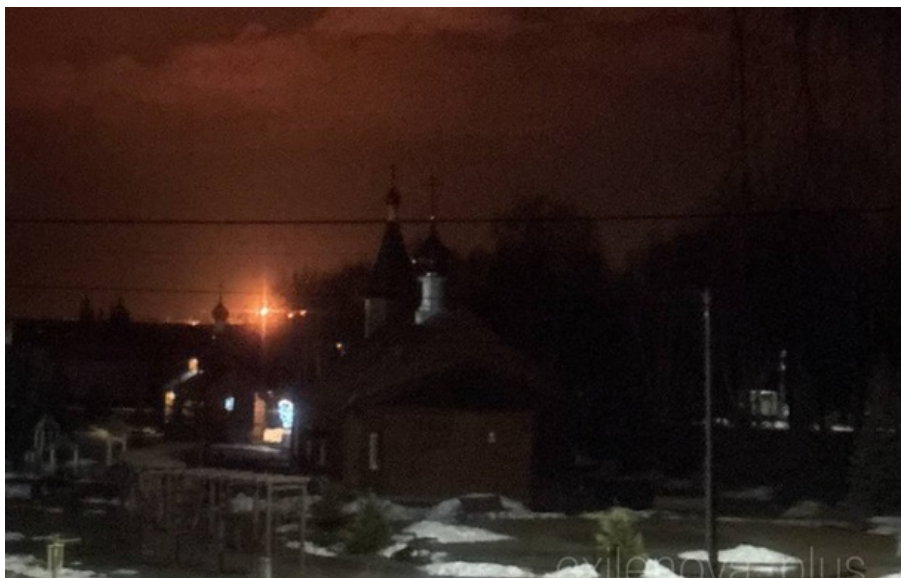
Кстово, Нижньогородська область РФ, влучання у НПЗ

Українська сторона, попри застереження західних партнерів, продовжує реалізацію власної стратегії "кінетичних санкцій", використовуючи зброю власного виробництва для послаблення економічного потенціалу агресора.