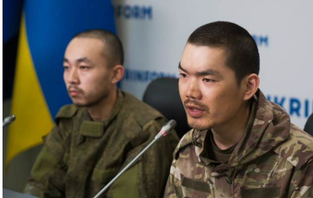
Фото: військовополонені з Китаю

Обирайте перевірене - додайте РБК-Україна до улюблених джерел у Google