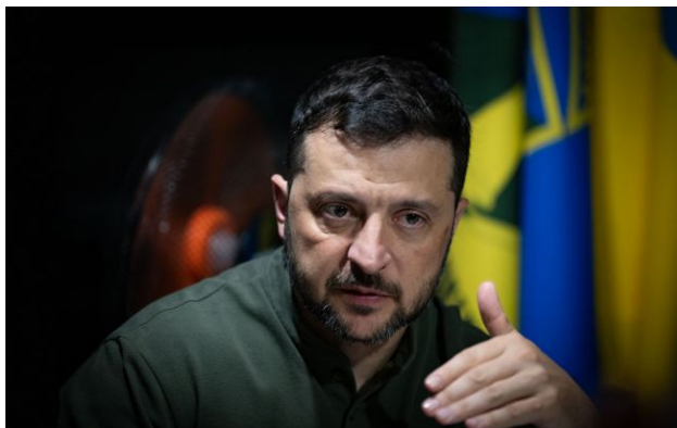
Фото: Володимир Зеленський, президент України

Росія обмежує доступ до соцмереж не для того, що обмежити критику російського диктатора Володимира Путіна. Однією з причин може бути підготовка до великої мобілізації.