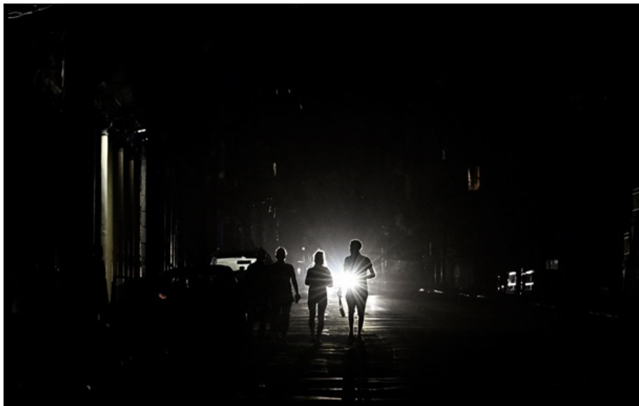
(ілюстративне фото) Блекаут на ТОТ

Моніторингові канали зазначають, що блекаут та перебої з водопостачанням сталися після удару по Старобешівській ТЕС.