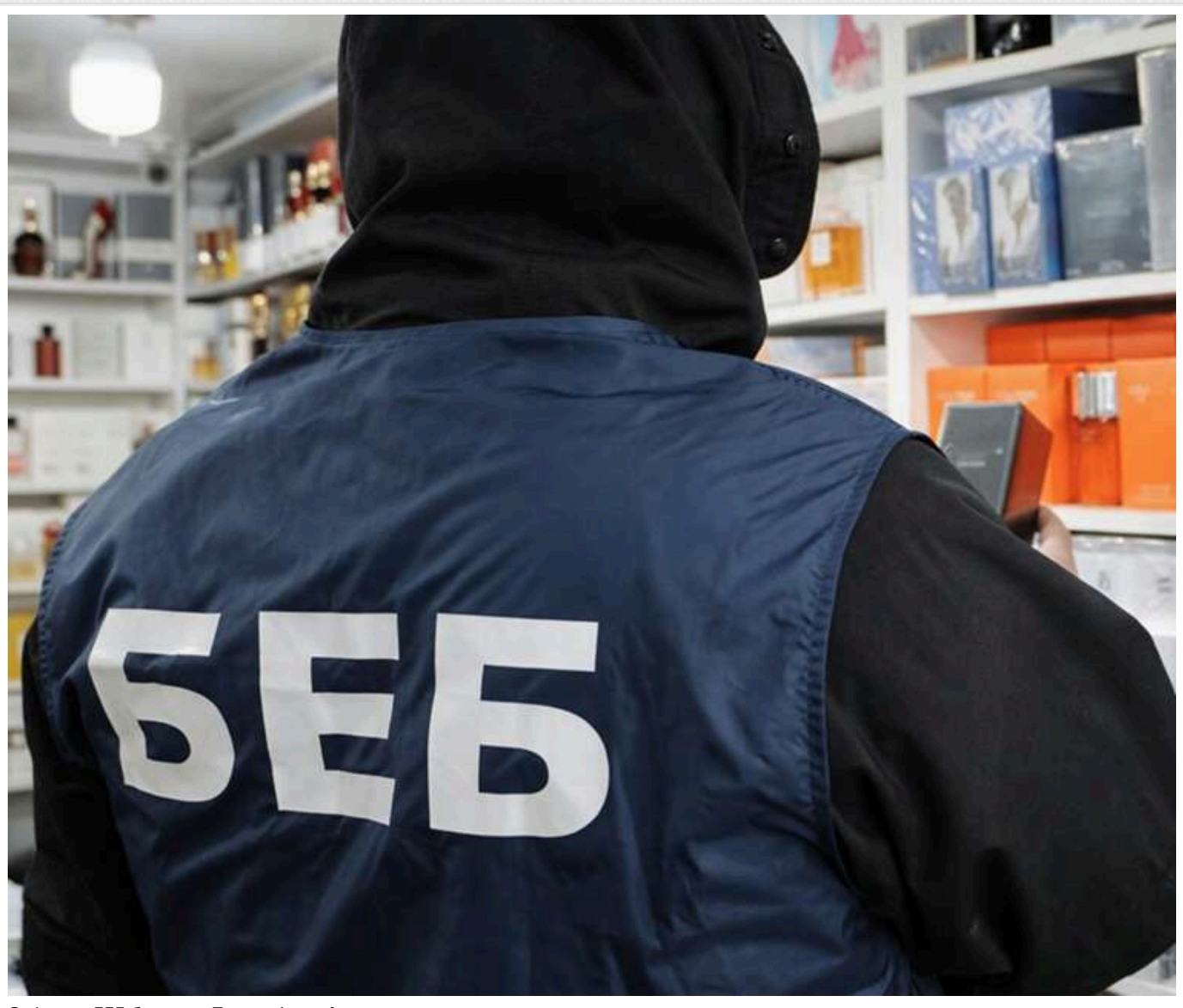
Реформа БЕБ буксує: в Полтаві скандал

Реформа Бюро економічної безпеки, проголошена її очільником Олександром Цивінським, буксує. Про це свідчать чисельні сигнали з міськ - від бізнесу й самих детективів БЕБ. В окремих теруправліннях конкурси на заступників керівників і атестації детективів набули трагічно-корупційних ознак. У лідерах скандалів знову Полтавська область.