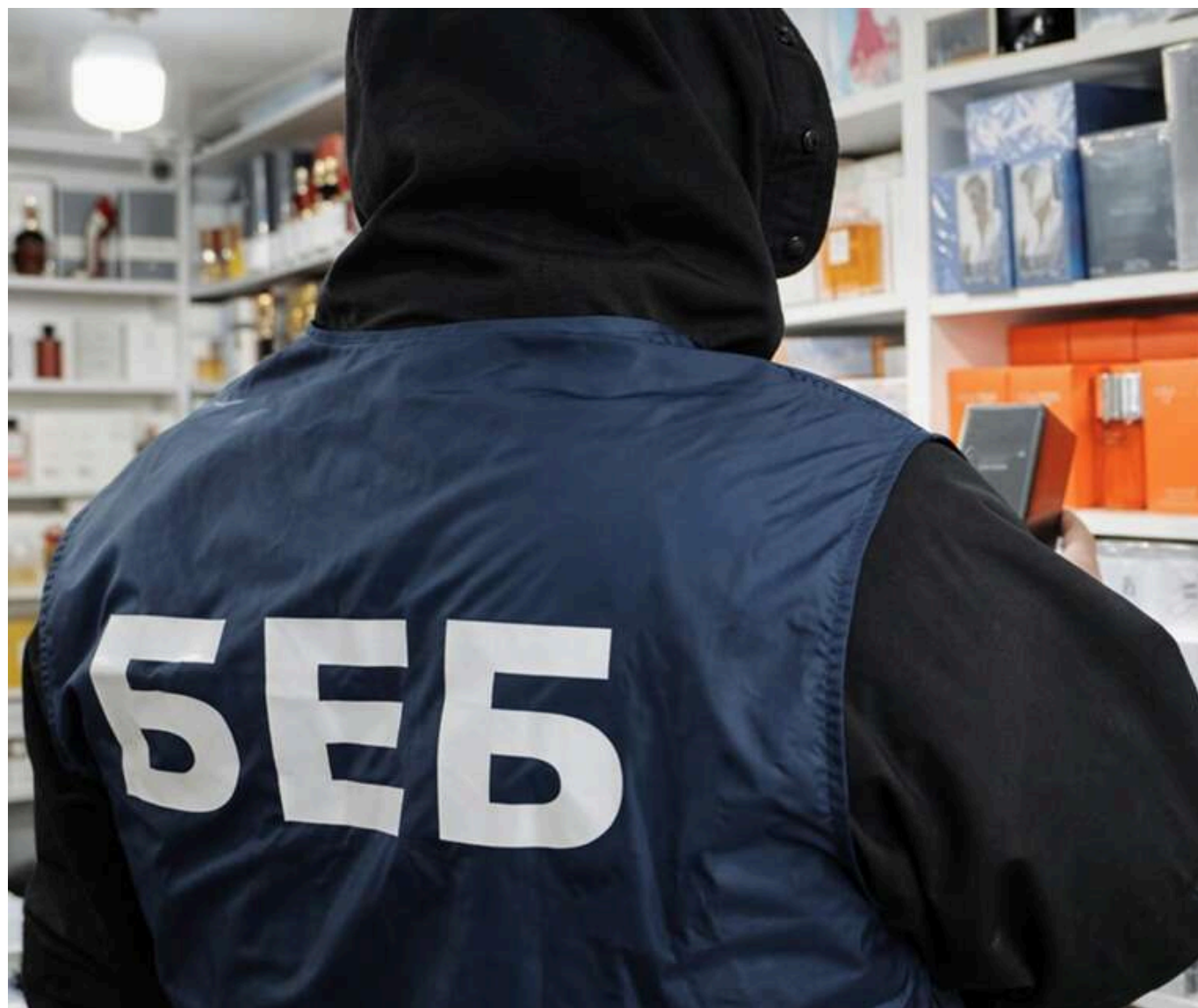
Реформа БЕБ буксує: в Полтаві скандал

Читати на руськом Додати як бажане джерело в Google