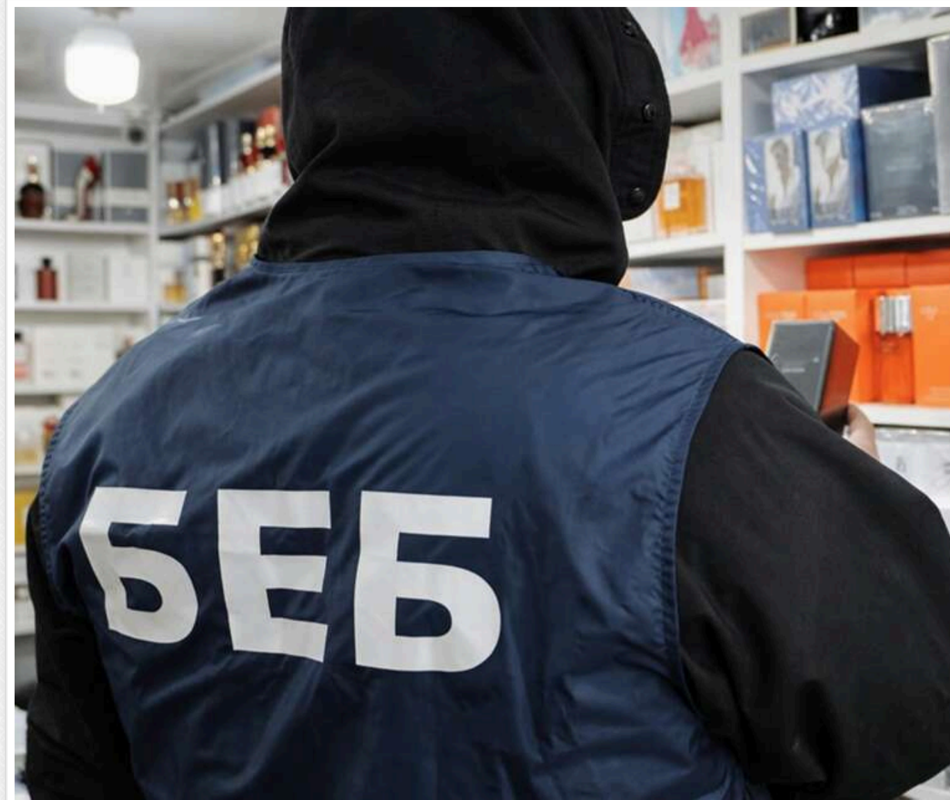
Реформа БЕБ буксує: в Полтаві скандал

Реформа Бюро економічної безпеки, проголошена її очільником Олександром Цивінським, буксує. Про це свідчать чисельні сигнали з місць - від бізнесу й самих детективів БЕБ. В окремих територіальних конкурсах на заступників керівників і атестації детективів набули трагічно-корупційних ознак. У лідерах скандалів знову Полтавська область.