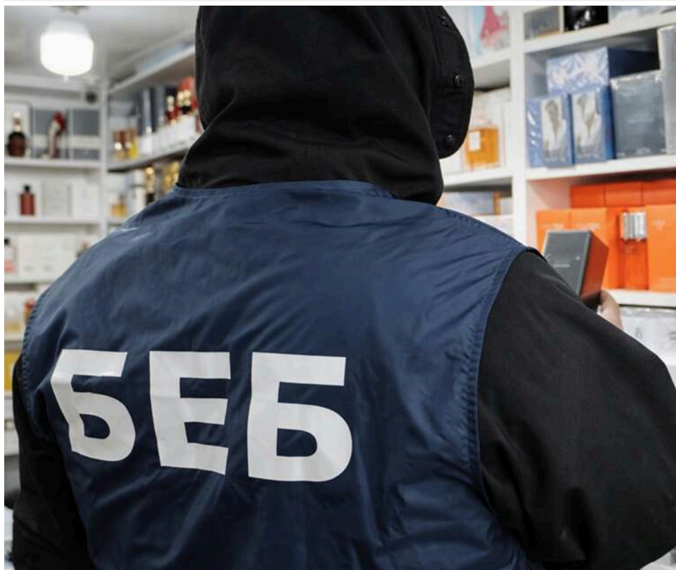
Реформа БЕБ буксує: в Полтаві скандал

Реформа Бюро економічної безпеки, проголошена її очільником Олександром Цивінським, буксує. Про це свідчать чисельні сигнали з місць - від бізнесу й самих детективів БЕБ. В окремих територіальних конкурсах на заступників керівників і атестації детективів набули трагічно-корупційних ознак. У лідерах скандалів знову Полтавська область.