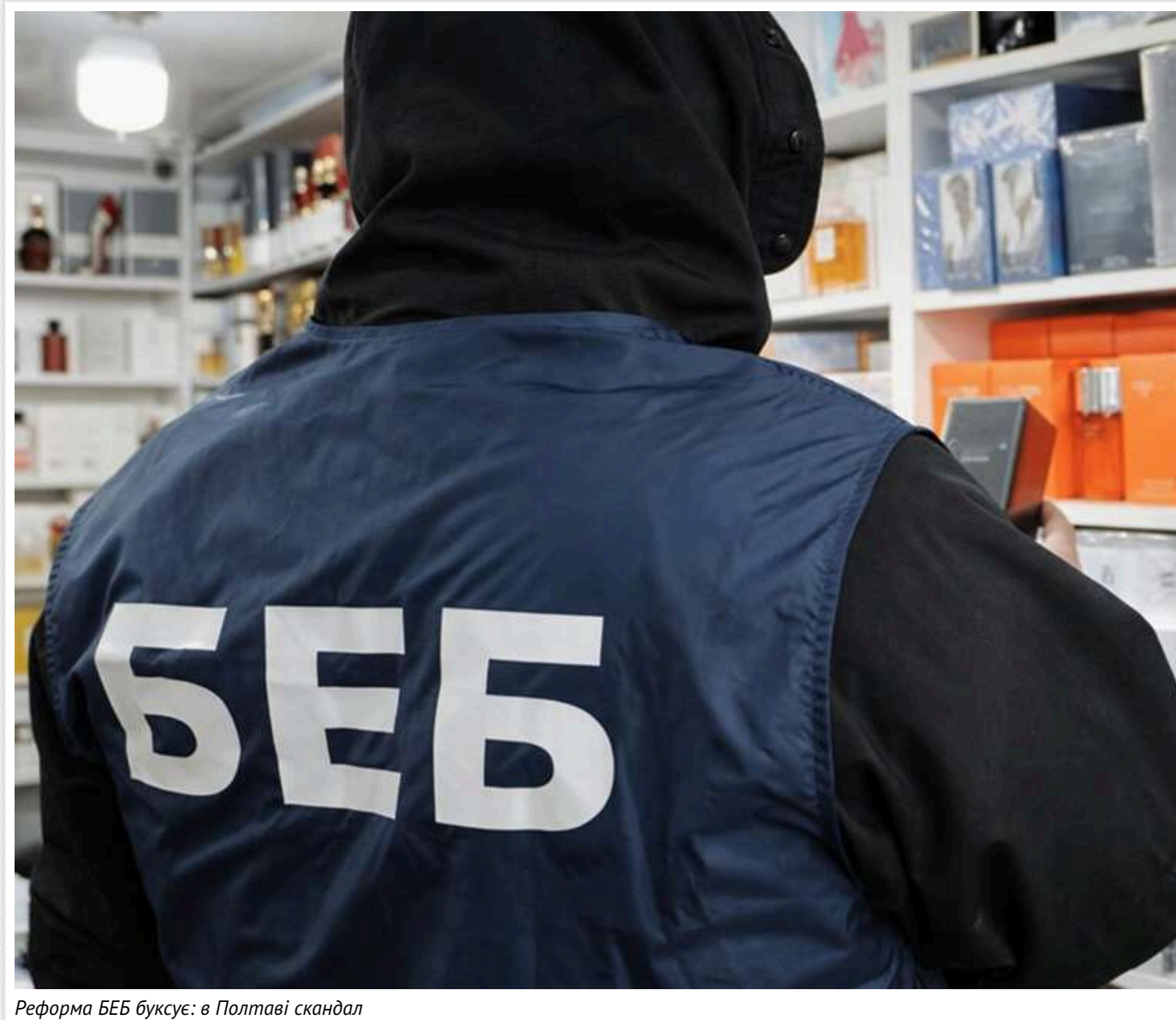
Реформа БЕБ буксує: в Полтаві скандал

Реформа Бюро економічної безпеки, проголошена її очільником Олександром Цивінським, буксує. Про це свідчать чисельні сигнали з міськ - від бізнесу й самих детективів БЕБ. В окремих територіальних конкурсах на заступників керівників і атестації детективів набули трагічно-корупційних ознак. У лідерах скандалів знову Полтавська область.