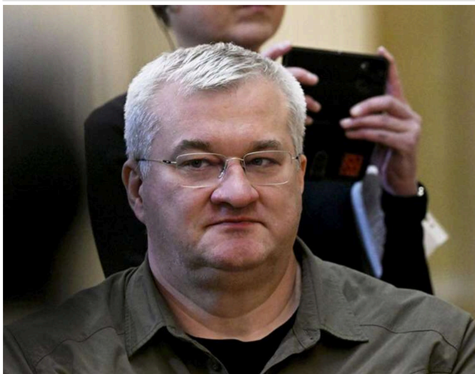
Сім масованих атак на місяць: Сибіга озвучив дані розвідки про нову тактику ракетно-дронового терору РФ

РФ готується провести масовані атаки на Україну 7 разів на місяць, – міністр закордонних справ України Андрій Сибіга.