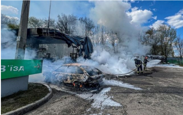
Фото: удар по АЗС у Харкові

Обирайте перевірене - додайте РБК-Україна до улюблених джерел у Google