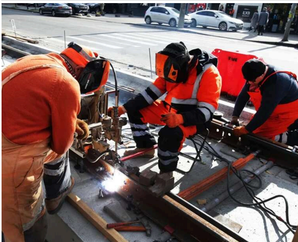
Трудовий дефіцит: Україна планує залучити працівників з Африки для порятунку ринку праці

Україна залучає іноземних працівників: планують привабити кадри з Африки через брак робочої сили.