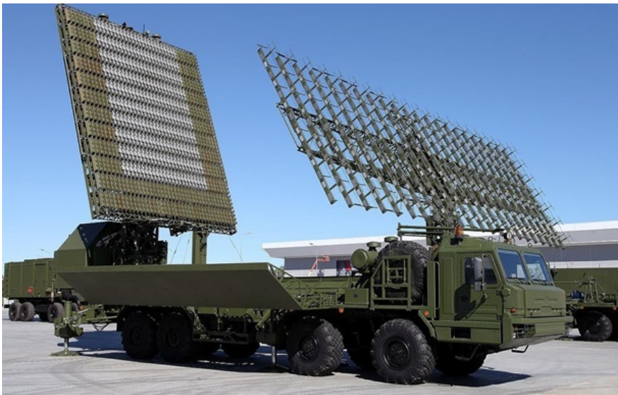
Російська радіолокаційна станція Небо-М