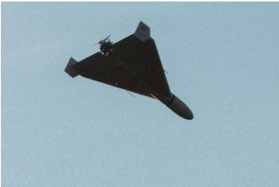
Дрон РФ залетів на 16 км углиб Румунії: Міноборони країни підтвердило порушення повітряного простору

Під час російського удару по району Ізмаїла безпілотник проник у Румунію на 16 км, повідомило румунське Міноборони.