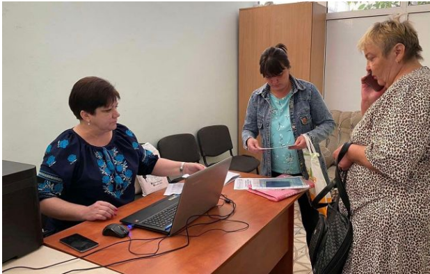
Фото: у Пенсійному фонді пояснили, як оцифрувати трудову книжку (ПФУ)

Обирайте перевірене - додайте РБК-Україна до улюблених джерел у Google