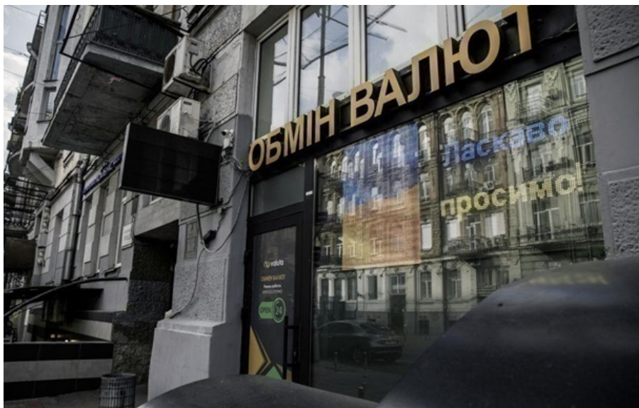
Обмінники купують долар у середньому по 43,65 гривні

Середній курс продажу долара зріс до рівня 43,80 гривні, а курс продажу євро піднявся до 51,60 гривні.