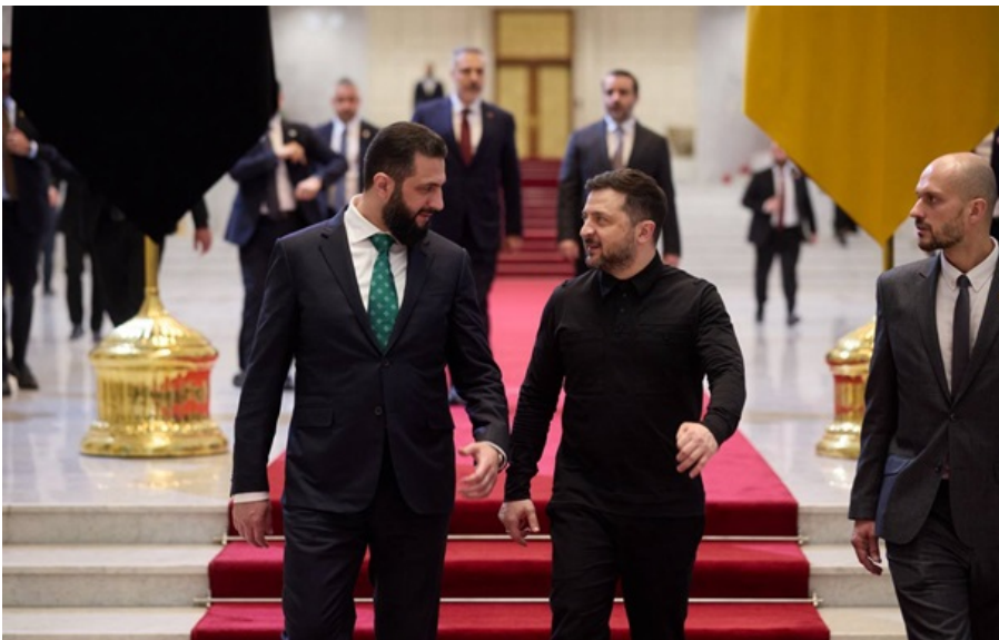
Президент Сирії Ахмед аш-Шараа і президент України Володимир Зеленський

Сторони обговорили широке коло питань: від безпекових та оборонних аспектів і ситуації навколо Ірану до енергетичної та інфраструктурної співпраці між країнами.