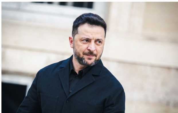
Фото: президент України Володимир Зеленський

Обирайте перевірене - додайте РБК-Україна до улюблених джерел у Google