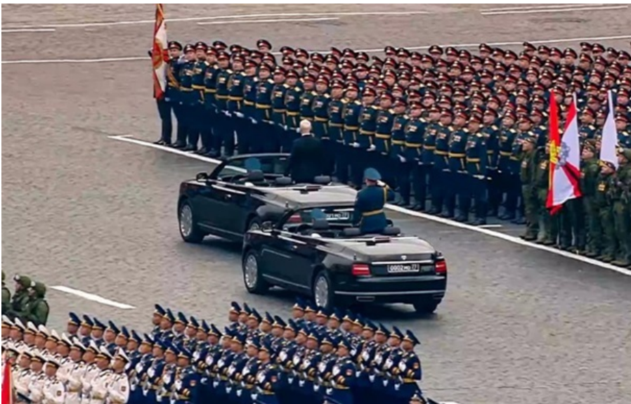
Підсумки 09.05

У Путіна висловили своє бачення зустрічі з Зеленським; у Москві відбувся найкоротший в історії парад. Кореспондент.net виділяє головні події вчорашнього дня.