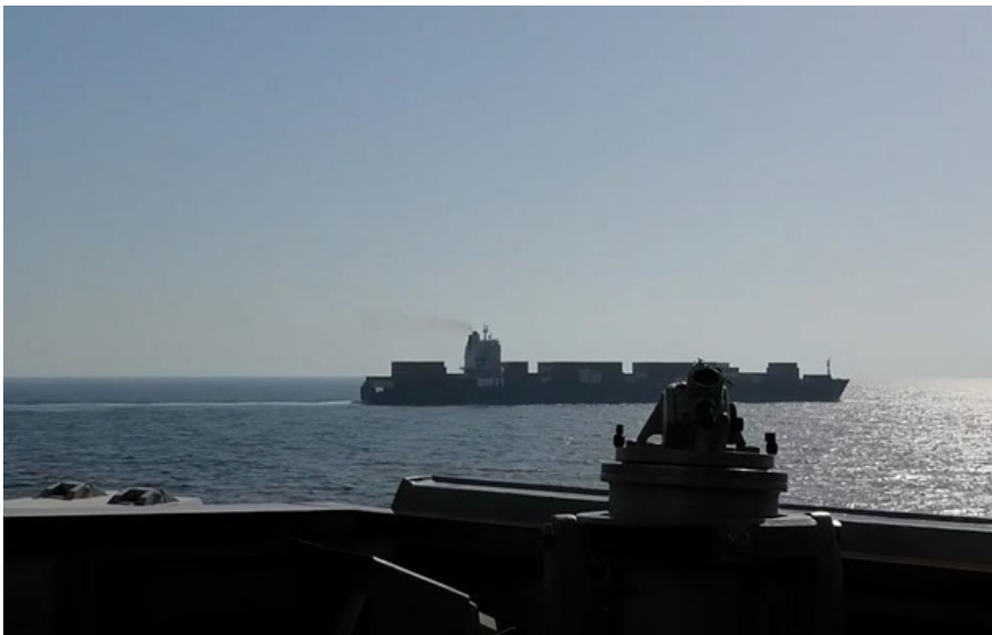
(ілюстративне фото) Американська сторона про ракетну атаку поки що не повідомляла

Дві іранські ракети поцілили в корабель ВМС США, який "порушив безпеку руху", заявили іранські ЗМІ.