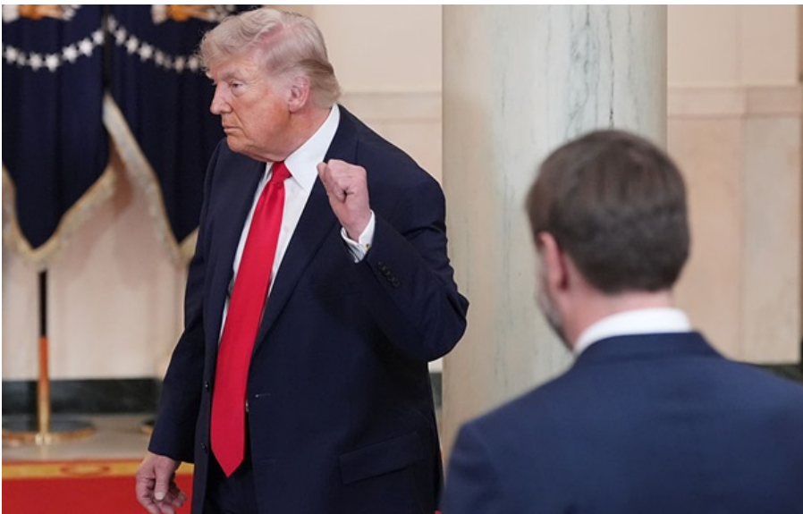
Дональд Трамп подписал указ

Если компании перенесут свое производство в США, то тариф на продукцию снизится до 20%.