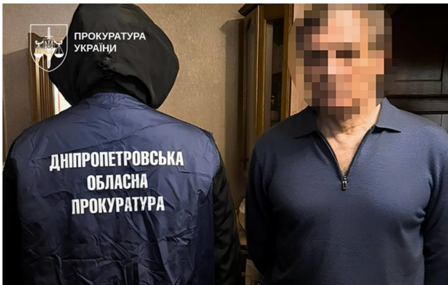
Бізнесмен організував постачання понад 100 одиниць обладнання в РФ

Йдеться про постачання понад 100 одиниць електрообладнання до РФ на суму більш як 11,5 млн грн.