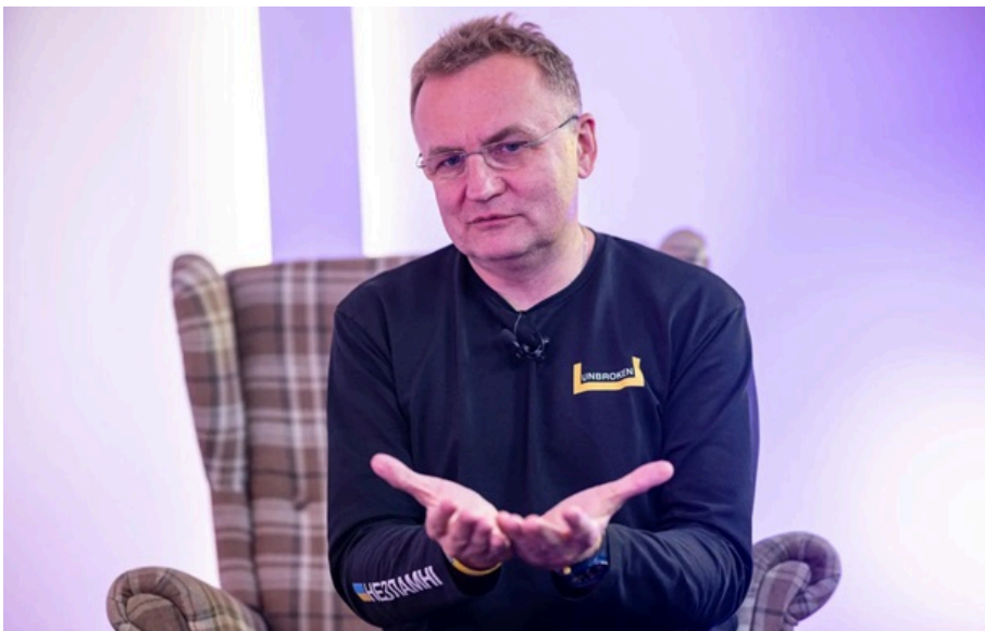
Андрій Садовий

потрапив у відео блогера, де подружжя розповіло про свої образи, секрети міцного шлюбу та несподівану звичку політика не змінювати улюблене взуття роками.