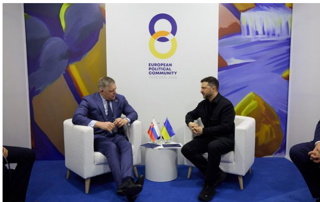
Фото: Володимир Зеленський та Роберт Фіцо (x.com/ZelenskyUa)

Обирайте перевірене - додайте РБК-Україна до улюблених джерел у Google