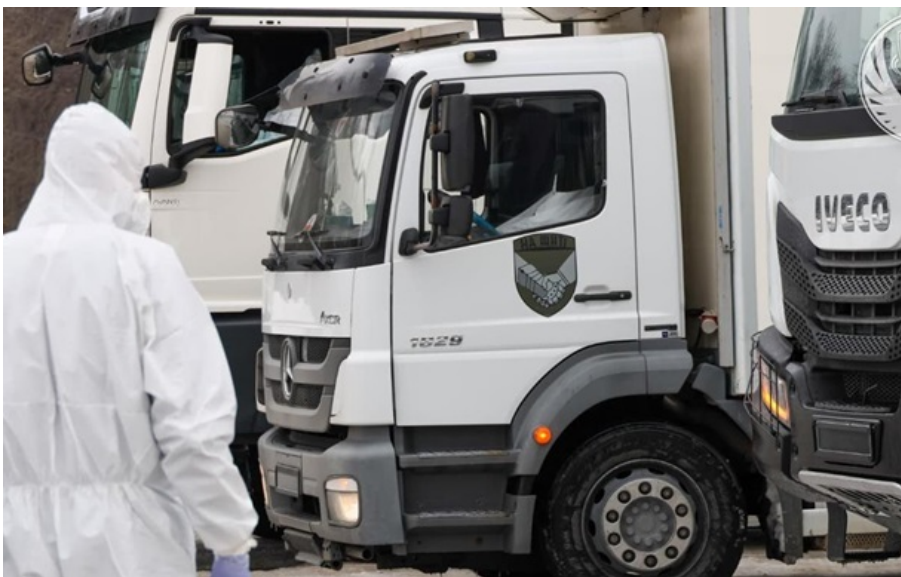
Фото: Координаційний штаб з питань поводження з військовополоненими РФ закатувала 375 полонених українців - передали тіла з ознаками тортур