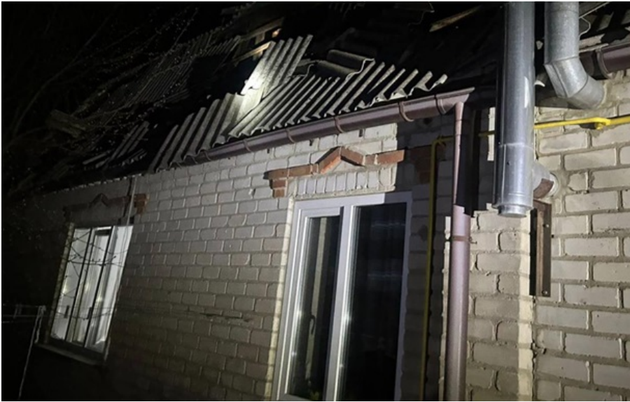
Наслідки російського удару по Люботину