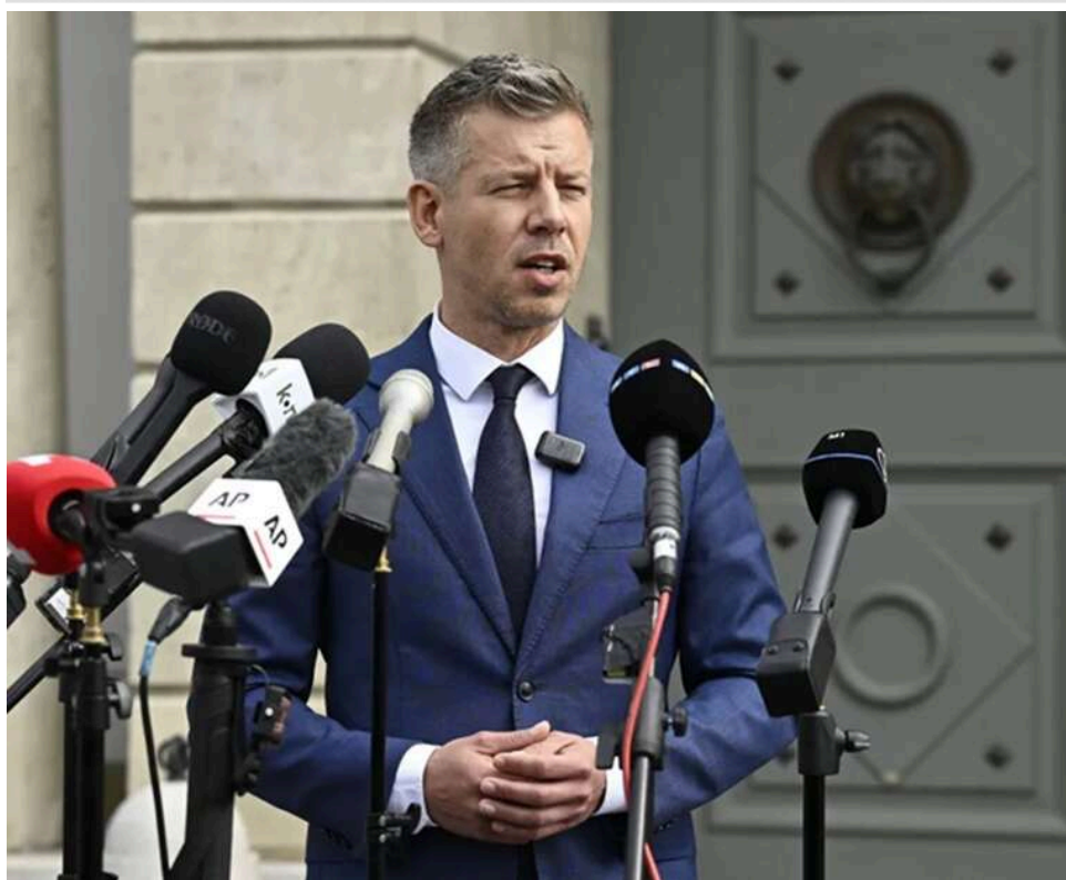
Тіньові ігри Орбана: Петер Мадяр звинуватив попередню владу в перекиданні мігрантів до Словаччини заради Фіцо

Лідер угорської партії «Тиса», яка здобула перемогу на парламентських виборах, Петер Мадяр, заявив, що уряд Віктора Орбана нібито направляє нелегальних мігрантів до словацького кордону на користь Роберта Фіцо. В Братиславі ці звинувачення спростували.