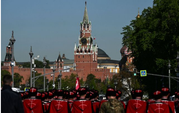
Фото: що відомо про відключення інтернету в Москві

Обирайте перевірене - додайте РБК-Україна до улюблених джерел у Google