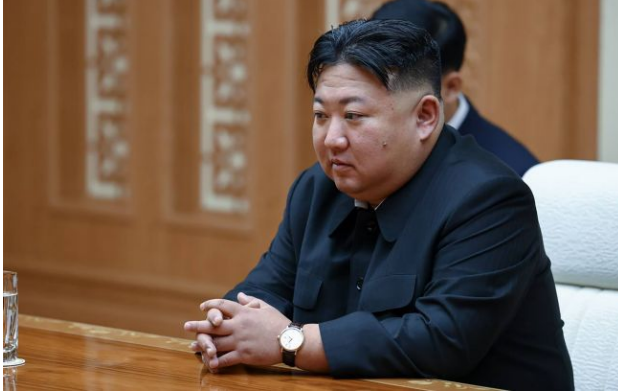
Фото: Кім Чен Ин (Getty Images)

Обирайте перевірене - додайте РБК-Україна до улюблених джерел у Google