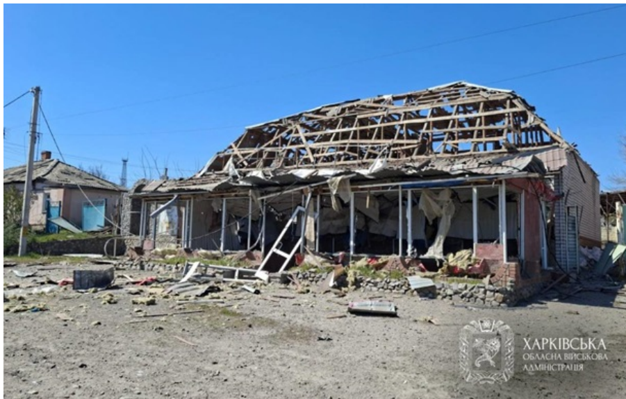
Наслідки російського удару по Мерєфі

Пошкоджено щонайменше 10 домоволодінь, чотири магазини, СТО, адмінбудівлю, два автомобілі і заклад харчування.