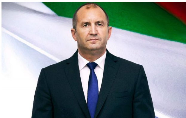
Фото: колишній президент Болгарії Румен Радев (facebook.com/President.bg)

Партія "Прогресивна Болгарія" колишнього президента Румена Радева здобуває впевнену перемогу на дострокових виборах до Національних зборів.