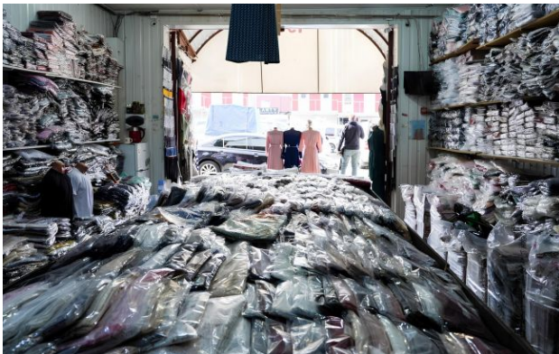
Фото: Нацполіція ліквідувала схему (t.me/UA_National_Police)

Обирайте перевірене - додайте РБК-Україна до улюблених джерел у Google