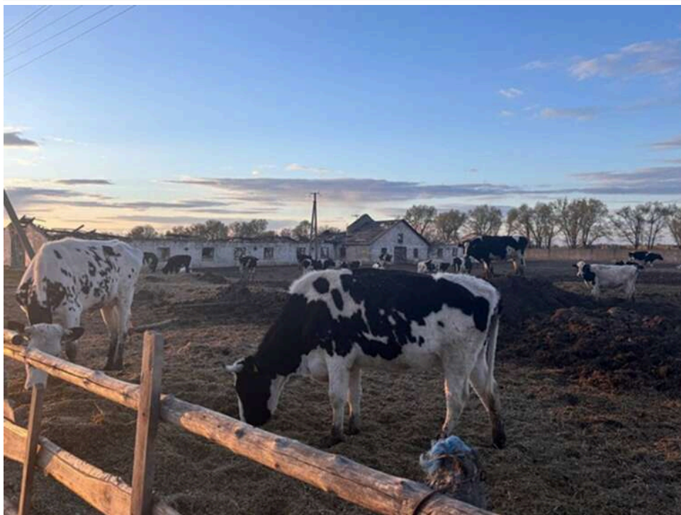
Загибель худоби в багнюці: поліція та прокуратура перевіряють держпідприємство «Рихальське» на Житомирщині

На держпідприємстві «Рихальське» розслідують загибель корів. Колишні працівники заявляють про можливі порушення та приховування фактів.